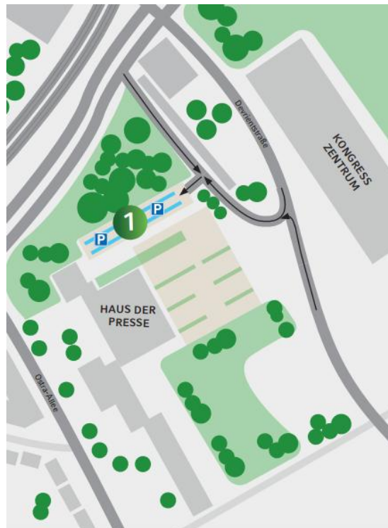
Trailerparkplatz, Devrientstraße, Einfahrt über Schranke mit Stichwort „Sachsen Classic“

Transportfahrzeuge und Anhänger können während der gesamten Veranstaltung auf dem Gelände der DDV Mediengruppe abgestellt werden. Adresse: Devrientstraße, 01067 Dresden. Bitte aufgrund der begrenzten Fläche platzsparend parken.